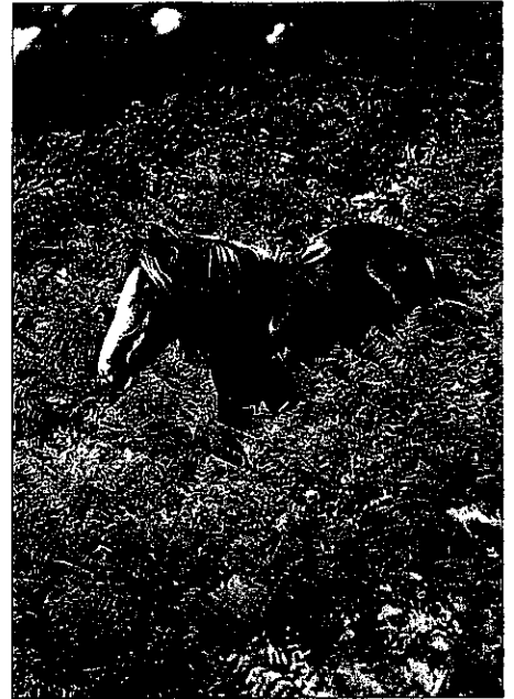
Le «larre pottoka», élevé sur des terres acides sur lesquelles ne poussent que fougères et herbe rase, est d'une constitution résistante.