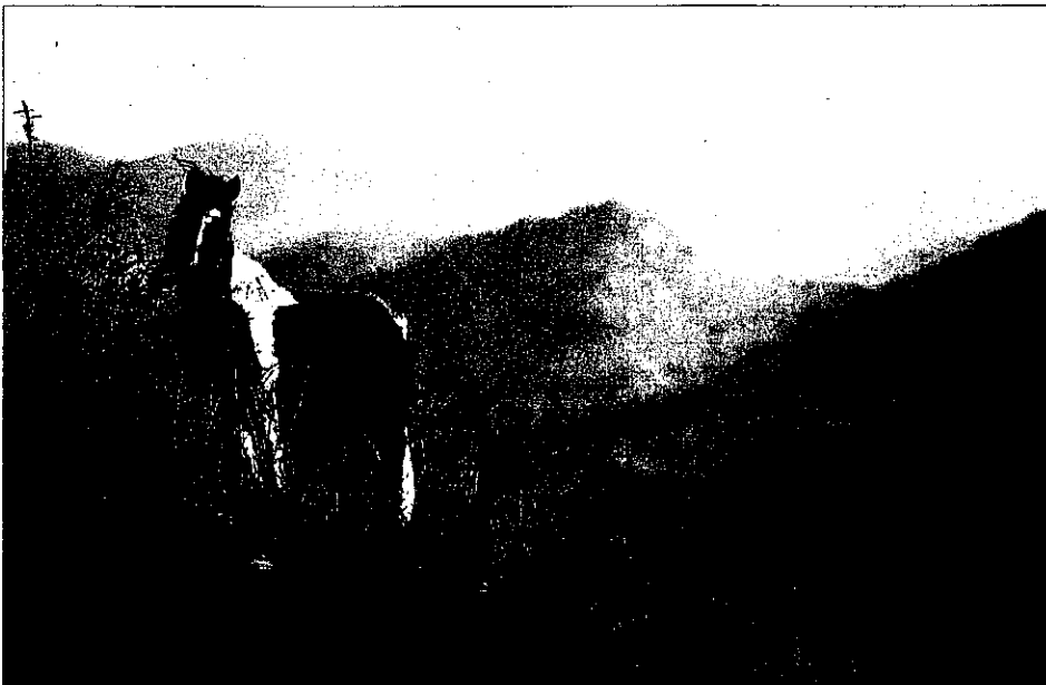
La robe pie (pie-noire ou pie-alezan) est particulièrement bien représentée, aussi bien dans les rangs du pottok des montagnes que dans ceux du poney des champs.