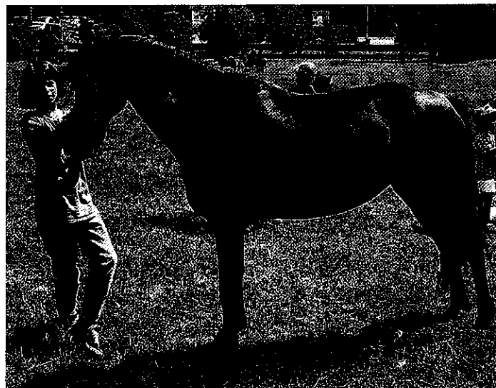
Einmalig in der Schweiz ist bis jetzt Cahntxo – sie ist die Mischung aus einer Pottok-Stute mit einem Araberhengst