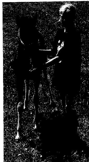
Zum Verlieben – ein Pottok-Fohlen

Sie sind klein, ausdauernd und zutraulich. Die Rede ist vom Pottok, welches im Baskenland zuhause ist. Doch auch in der Schweiz hat das kleine Pferd Liebhaber gefunden. Wir wollten mehr über diese hier eher unbekannte Rasse erfahren.